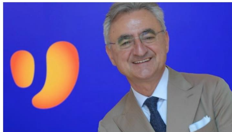
A Unieuro il premio di 'Migliore Insegna' per Elettrodomestici ed Elettronica

Unieuro è stata votata "Migliore Insegna 2024" nella categoria Elettrodomestici ed Elettronica, dopo un'indagine indipendente condotta da Largo Consumo e Ipsos. Unieuro ha performato in tutte le 5 macrocategorie, con particolare riferimento a Offerta e Punto vendita.